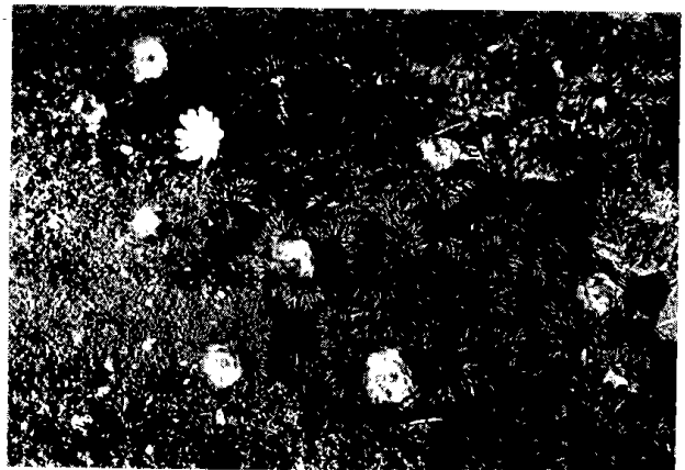
(フクジュソウ)

(懸先生は春・夏・秋・冬をテーマにして随筆をご寄稿下さいました。次号は、ラベンダーの香り(夏)です。)