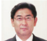
歯学部 同窓会会長