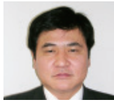
薬学部 同窓会会長