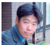
看護学科 同窓会会長