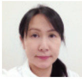
言語聴覚療法学科 同窓会会長