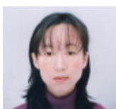
歯科衛生士専門学校 同窓会会長