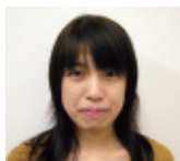
臨床福祉学科 同窓会会長