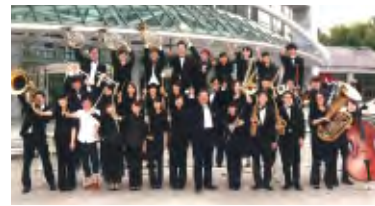
北海道吹奏楽コンクール札幌地区予選 金賞