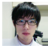
言語聴覚療法学科 同窓会会長