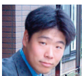
看護学科 同窓会会長