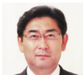
歯学部 同窓会会長