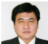
薬学部 同窓会会長