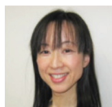
歯科衛生士専門学校 同窓会会長