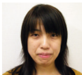
臨床福祉学科 同窓会会長