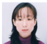
歯科衛生士専門学校 同窓会会長