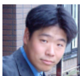
看護学科 同窓会会長