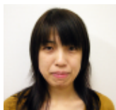
臨床福祉学科 同窓会会長