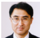
歯学部 同窓会会長