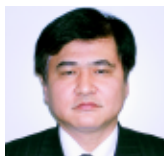
薬学部 同窓会会長